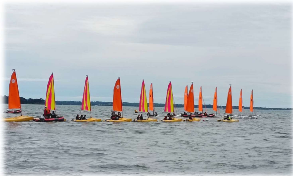
Classe Découverte CM1-CM2 (Morbihan - juin 2024)