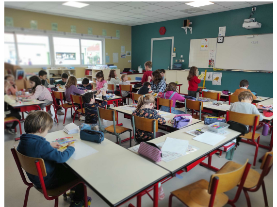
Classe de CP rénovée