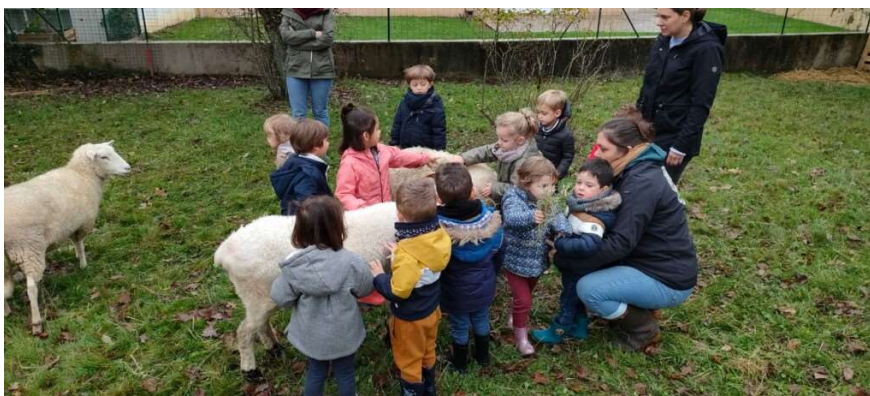
Des moutons à l'école

Les informations sont indiquées dans l' annexe financière . Merci de vous y reporter.