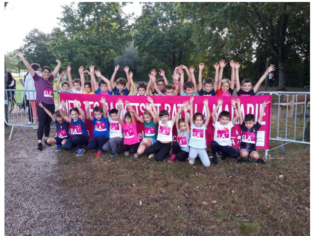
Mets tes baskets et bats la maladie, avec ELA (projet